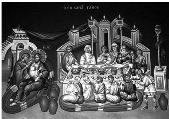
Foto: Die Hochzeit zu Kana. Die Ikone ist ein Kunstwerk der Ikonenwerkstatt Ch. A. E. Voutsinas, Thessaloniki/ Griechenland. Sie gehört zum Ikonenzyklus der griechisch-orthodoxen Metropolitankathedrale „Agia Trias“ zu Bonn

Syrisch-Orthodoxe Kirche aus Indien Bischof Mar Timotheus