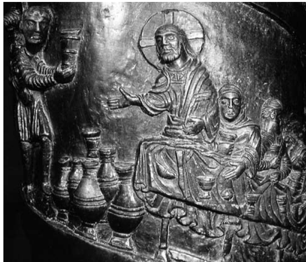
Hochzeit in Kana, Christussäule (Bernwardsäule), St. Michaelis Hildesheim.