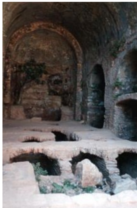
Die Grotte der Heiligen Siebenschläfer in Ephesus

Ihre Feste werden am 17. (4.) August und am 4. November (22. Oktober) gefeiert.