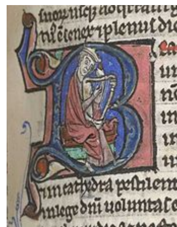
Fécamp-Bibel (13. Jh.), Initiale B (Beatus): König David als Harfenspieler

Die Nummerierung der Psalmen unterscheidet sich geringfügig zwischen dem hebräischen Text in der masoretischen Textfassung einerseits und den Übersetzungen der griechischen Septuaginta und der lateinischen Vulgata andererseits, da der in der Liturgie verwendete lateinische Text der Psalmen auf der Septuaginta beruht – anders als die anderen alttestamentlichen Texte der Vulgata, die Hieronymus direkt aus dem Hebräischen übersetzt hat. Evangelische Bibeln zählen wie der Urtext, den Martin Luther für seine Übersetzung verwendete. Ältere katholische Bibeln verwendeten die Zählung der Septuaginta bzw. Vulgata. Die in der katholischen Kirche jetzt verwendete lateinische Bibelausgabe, die 1979 herausgegebene Nova Vulgata , folgt der Nummerierung des masoretischen Texts. Daher