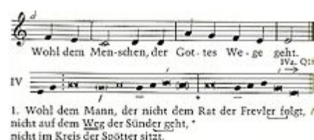
Vertonung von Psalm 1,1 als Psalmodie im IV. Ton mit Antiphon

Unter liturgischem Psalter versteht man in der Liturgiewissenschaft das Verteilungssystem der Psalmen bzw. der Psalmantiphonen auf die Tagzeiten (Horen) im Stundengebet . Als