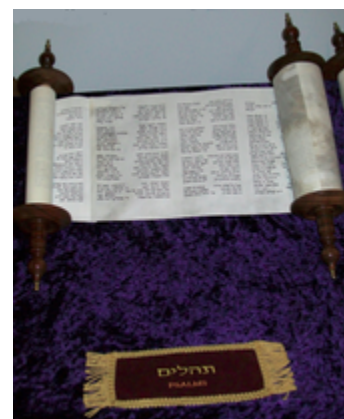
Schriftrolle der Psalmen

Das Psalmenbuch besteht aus ursprünglich selbständigen Teilsammlungen aus dem 6. bis 3. Jahrhundert v. Chr., die in mehreren Phasen zusammengestellt wurden. Wann die Sammlung abgeschlossen wurde, ist zwar unsicher, in der Forschung werden aber tendenziell die Jahre zwischen 200 und 150 v. Chr. angegeben. Dafür spricht die Nähe zur späten Weisheitsliteratur , die bei den jüngsten redaktionellen Bearbeitungen des Psalters erkennbar wird.