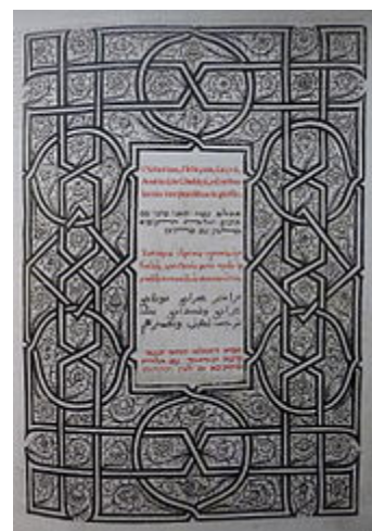
Psalterium in hebräischer, griechischer, arabischer und chaldäischer (aramäischer) Sprache mit lateinischem Kommentar. Genua 1516

Eine hebräische Bezeichnung für die Psalmen, auf die die griechische zurückgehen könnte, ist nicht bekannt, auch wenn der Gebrauch der Pluralform mizmorot im palästinischen Schrifttum als Bezeichnung für die Gesamtheit der Psalmen belegt ist. [2] In der rabbinischen Literatur durchgesetzt hat sich dagegen die Bezeichnung סֵפֶר תְּהִלִּים ( Sefer tehillim , „Buch der Lobpreisungen“) oder kurz Tillim (aramäisch Tillin ), die im Judentum seither verwendet